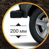
Клиренс – 200 мм