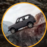
Угол въезда – 38° Угол съезда – 28°